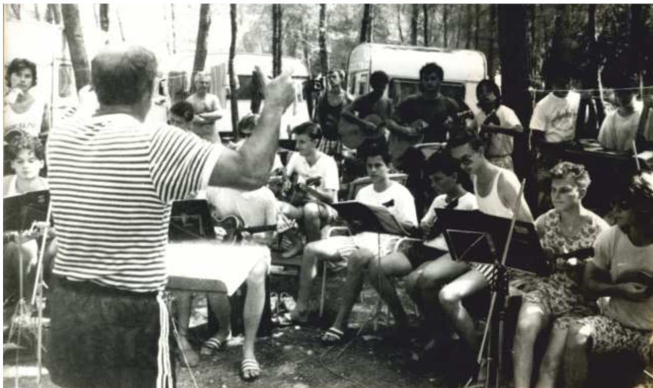
Ljetna turneja, Mali Lošinj, proba prije koncerta, kamp u uvali Čikat, kolovoz 1989.