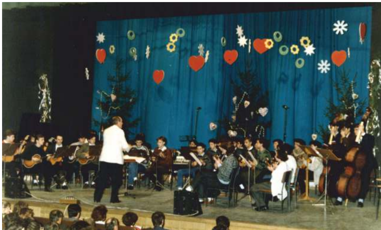
Novogodišnji koncert Tamburaškog orkestra RKUD-a Đuro Salaj , 1. siječnja 1989.

jesenskim i zimskim) i prostorima. Prvi koncert u klastru Franjevačkog samostana održan je 2. kolovoza 1989. godine, a ostali u crkvi Presvetog Trojstva.