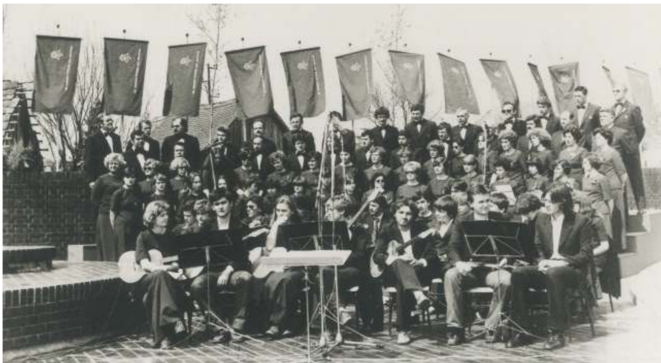
Mješoviti pjevački zbor i Tamburaški orkestar RKUD-a Đuro Salaj pred nastup na otvorenju Spomen parka Đuro Đaković , Brodski Varoš, 21. travnja 1979.

himna. Svečane priredbe i akademije u povodu Dana žena organizirane su do 1989. godine, program su izvodile sve glazbene sekcije, održavane su u Spomen domu Đuro Salaj , a ponekad su reprizirane u restoranu SOUR-a Đuro Đaković .