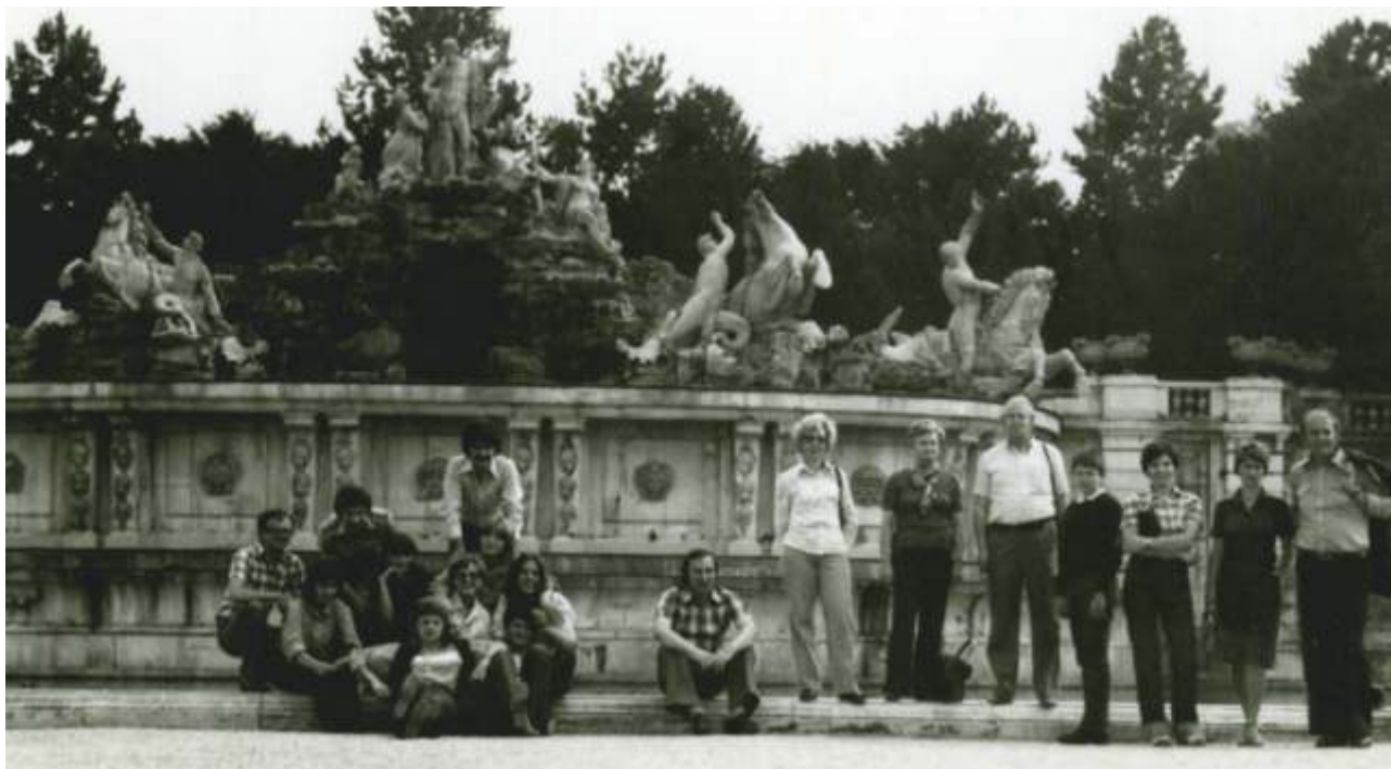
Na putu za Čehoslovačku, posjet dvorcu Schönbrunn, Beč, 1978.