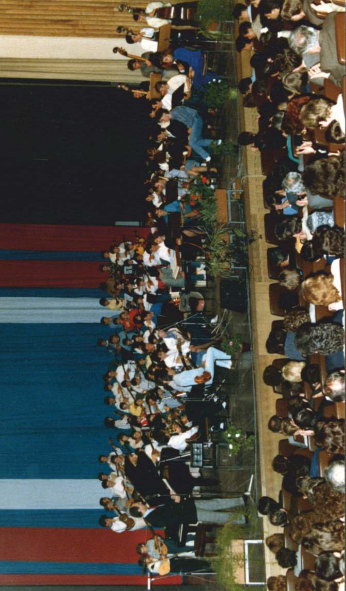
Na završetku godišnjeg koncerta najčešće su nastupali svi Salajevi tamburaški orkestri (pionirski, pripremni i reprezentativni). Televizijski voditelj Oliver Mlakar vodio je program koncerta održanog 20. travnja 1988. te programe svečanih proslava u povodu obljetnica SOUR-a Đuro Đaković na kojima je orkestar bio česti gost