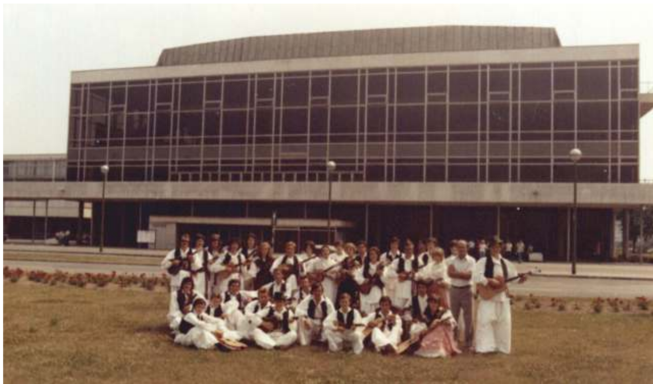
Tamburaški orkestar RKUD-a Đuro Salaj ispred Koncertne dvorane Vatroslav Lisinski , 1976.

Nastup u Koncertnoj dvorani Vatroslav Lisinski u Zagrebu za svakog je glazbenika i svaki ansambl, osobito amaterskog statusa, izuzetna čast i veliko priznanje. Tamburaški orkestar RKUD-a Đuro Salaj nastupao je prvi puta na pozornici velike dvorane na X. jubilarnom festivalu Omladinske kulturne federacije Hrvatske bratske zajednice iz SAD-a, 3. srpnja 1976. godine, a drugi puta na koncertu Srce Šokadije Zagrebu u organizaciji zagrebačkog KUD-a Šokadija , 11. svibnja 1978. godine. Na drugom