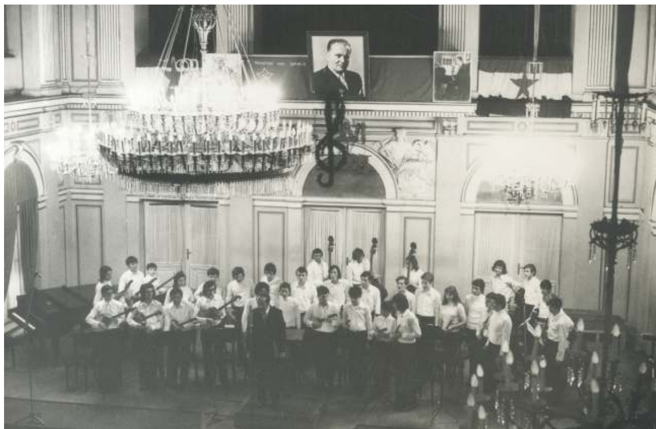
Tamburaški orkestar RKUD-a Đuro Salaj na prvom nastupu na republičkoj smotri u Velikoj koncertnoj dvorani Narodnog kazališta August Cesarec , Varaždin, 24. travnja 1973.