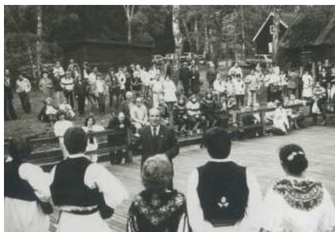
Koncert na otvorenom u etno-parku, Halmstad, 15. svibnja 1983.