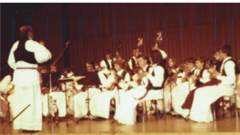
Na koncertu Srce Šokadije Zagrebu , Koncertna dvorana Vatroslav Lisinski , svibanj 1978.