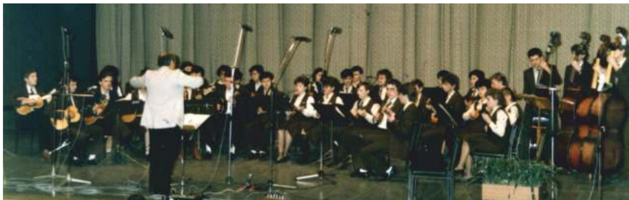
IV. smotra tamburaških orkestara i malih sastava Slavonije i Baranje, Spomen dom Đuro Salaj