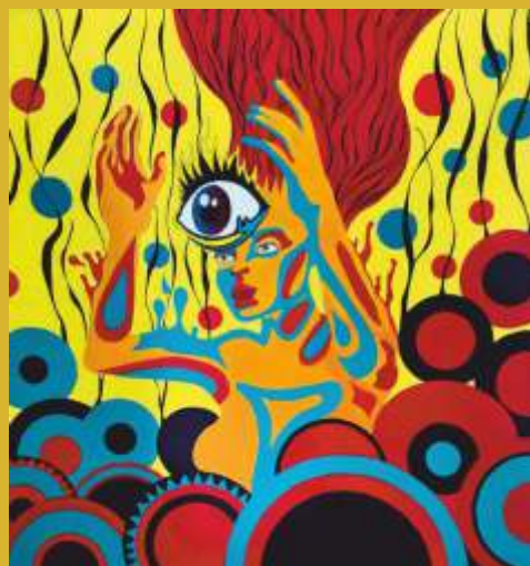
Dina Zorić, She's Lost Control , 2021.

Završila je Školu primijenjenih umjetnosti i dizajna u Osijeku, smjer scenografija. Inspiraciju za svoje radove crpi iz okoline i situacija iz svakodnevnog života. Naglasak stavlja na vlastita raspoloženja i osobne stavove, tako da njeni radovi uglavnom nastaju kao materijalizacija trenutnih misli i osjećaja, dok kroz neke pokušava ukazati na aktualnu problematiku društva i pojedinca kao što su ovisnosti, dvoličnost, prolazak vremena i sl.