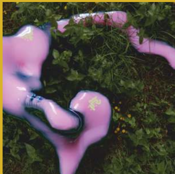
Marin Ćosić, Blob 1 , 2021.

Izložba predstavlja radove jedanaest autora različitih senzibiliteta i izričaja ali sa zajedničkom strašću za stvaranjem, bez obzira na trenutačna ograničenja.