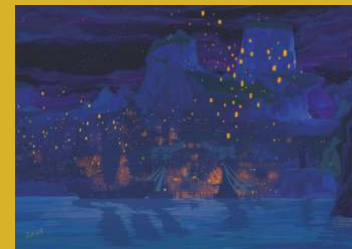
Sara Šetina, Liyue , 2021.

Student je kreativnog poslovanja na Sveučilištu u Haagu. Fotografijom se intenzivno bavi od početka srednje škole. Glavni interes i temeljni motiv Ivanovih fotografija je čovjek: od radnika dobrodušnog osmjeha, nespješnog prolaznika na ulici, grupe ljudi kao i pejzaža svakodneвно dostupnih njegovom pogledu koje bilježi kao dnevničke zapise protkane specifičnom atmosferom, prije svega obojenom vlastitim raspoloženjem. Kompozicija Ivanovih radova odiše ravnotežom elemenata forme, što sugerira harmoniju čovjeka i okoline, bilo da se radi o urbanim motivima ili prikazu nekultiviranog pejzaža.