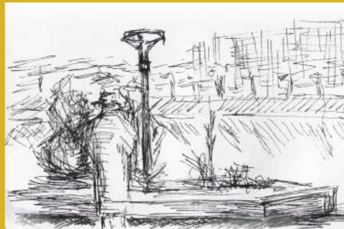
Lucija Tolić, Promenada , 2021.